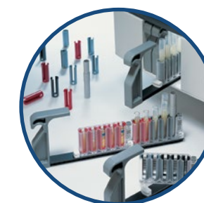
Использование первичных пробирок