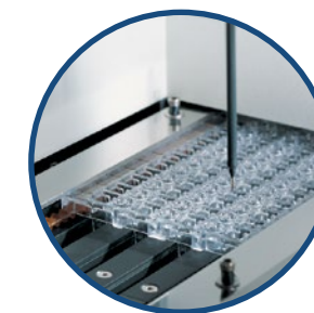
Унифицированный реакционный планшет